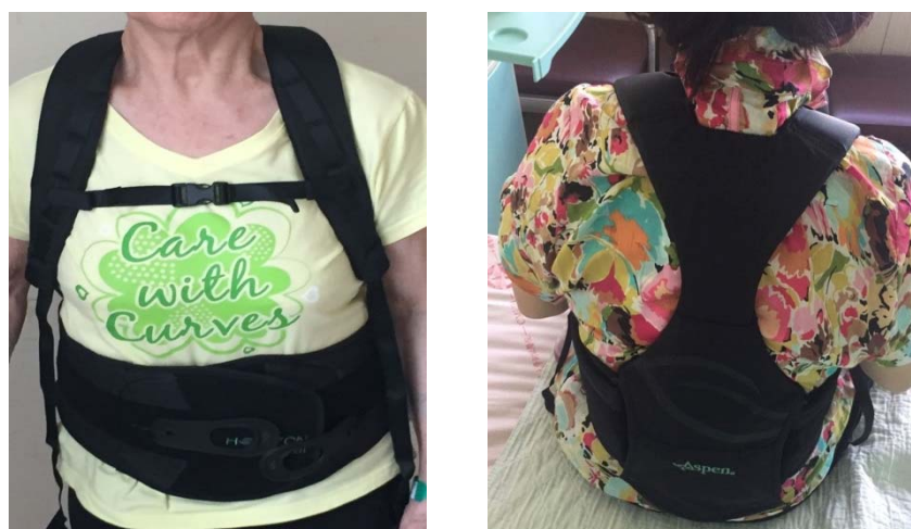
圖二 複合式背架（長背架）