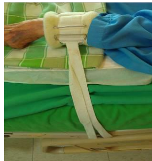
圖二 手腕式約束帶